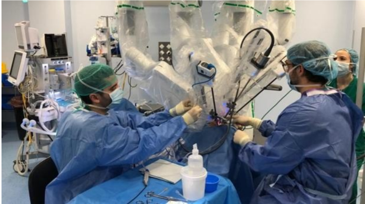
Imagen del robot de la unidad de Otorrinolaringología del Hospital Universitario Reina Sofía